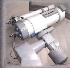
岐阜市科学館 50cm反射望遠鏡