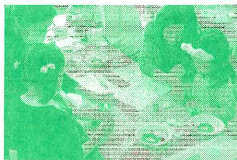
→ フェイクスイーツでチョコ型キーホルダーを作ろう (写真は昨年フェイクスイーツでクリスマスリースを作ろうの様子です)