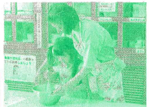
↑ ホットケーキを作ろう