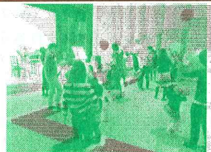
↑ はじめての親子リトミック