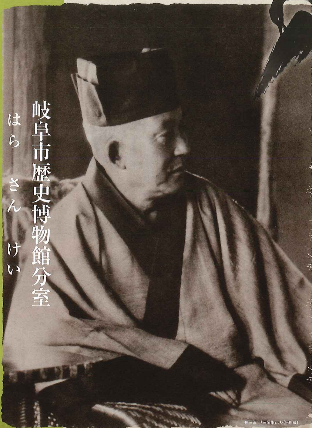
原三溪画 「鶴舟図」より(当館蔵)

もえぎの里2階にある岐阜市歴史博物館分室が、「原三溪記念室」にリニューアルオープンしました。