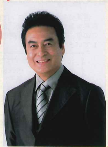
NHK大河ドラマ 「国盗り物語」 織田信長公役・ 高橋英樹さん

往復はがきに「高橋英樹トークショー申込」と明記し、往信裏面と返信表面に観覧を希望する人の郵便番号、住所、氏名、電話番号をご記入の上、岐阜市信長公450プロジェクト実行委員会事務局<〒500-8701 岐阜市今沢町18(信長公450プロジェクト推進課内)>までお申し込みください。※はがき 1枚につき1名のみ有効 です。返信裏面には何も記入しないでください。当選・落選の通知は3月17日(金)ごろ発送予定です。 ■締切 平成29年3月15日(水) 必着