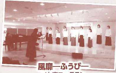
風靡ーふうびー ＜女声コーラス＞