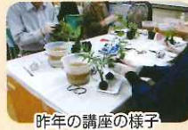
昨年の講座の様子

毎月ファッションライブラリーの展示や講座、子供向けおはなし会など、様々なイベントを行っています。また、西口や東口で、おでかけしたくなるような鉄道コーナーや、本のテーマを決めた展示もしていますので、ぜひのぞきにきてください。他にも、ビジネスに関するセミナーや、文学の講座などを毎年開催しています。イベント等のお知らせに関しては、広報ぎふ、または岐阜市立図書館分館へお問い合わせください。