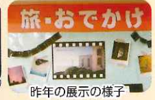
昨年の展示の様子