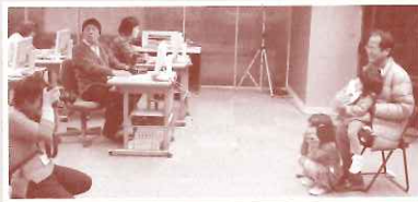
初心者パソコン相談とカレンダーづくり 岐阜ITコラボレーター会