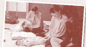
Babyとタッチコミュニケーション 一般社団法人岐阜県助産師会