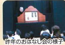
昨年のおはなし会の様子