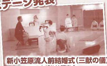
新小笠原流人前結婚式(三献の儀) 中部礼法研究会