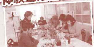
「下手でいい、下手がいい。」の 絵手紙を描いてみよう! 新日本婦人の会岐阜支部