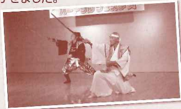
濃州神陰流桔梗館(剣舞・詩舞)