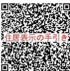
住居表示の手引き

所属している自治会として活動することが可能です。 住居表示を検討するスケジュールは、どうなるのか？ 今後、地域住民の皆さんへの説明会を開催していくと共に、住民同士での理解を深めていくために、時間を必要とします。また、街区符号に挿入する「地区を明記する文字」をどうすべきか検討を深めていく必要があります。そのため、岐阜市、鷺山自治会連合会、対象地区自治会長とも十分に議論を深めながら進めていきます。段階では、分かりませんが、可能な限り丁寧な検討、説明を踏まえた上で理解の得られる住居表示案を提示出来るようにしていきます。