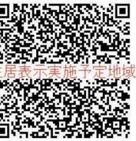
住居表示実施予定地域

住居表示の変更に伴い土地・建物等の所有者の住所変更、会社等の所在地の変更、運転免許証、金融機関、各種契約手続きに伴う住所変更が必要になります。今後、住居表示が実施された際には、どのような手続きが必要になるか詳細の説明及び資料の配付がされます。