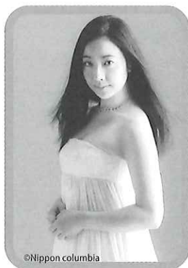
ソプラノ:小林 沙羅