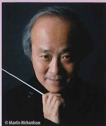
指揮 尾高 忠明 Tadashi OTAKA

1947年生まれ。国内主要オーケストラへの定期的な客演に加え、ロンドン響、ベルリン放送響など世界各地のオーケストラへ客演。これまで91年度第23回サントリー音楽賞受賞。93年ウェールズ音楽演劇大学より名誉会員の称号、ウェールズ大学より名誉博士号、97年英国エリザベス女王より大英勲章CBEを、さらに1999年には英国エルガー協会より、日本人初のエルガー・メダルを授与されている。