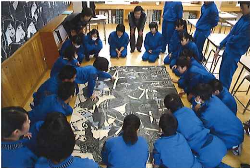
本展出品の共同版画制作風景 飛騨市立神岡中学校3年生の皆さん

皆さんが、版画にはじめて取り組んだのはいつでしょうか。岐阜県は、「飛騨版画」で知られる教育版画をはじめ、自画自刻自摺りによる創作版画に源を持つ版画家を多数輩出してきた地域です。本展では、岐阜県にゆかりのある版画家の作品を展示します。併せて教育の現場で取り組まれている版画の実践をご紹介します。様々な表現へ広がりゆく版の面白さをお楽しみください。会期中には、3人の本展出品作家によるワークショップを開催します。新たな版画の魅力に触れられる機会になることと思います。