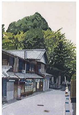
牧野光陽《緋しぐれ》2007年