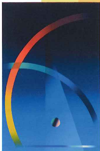
堀江良一《弧のある風景 01-4》2001年