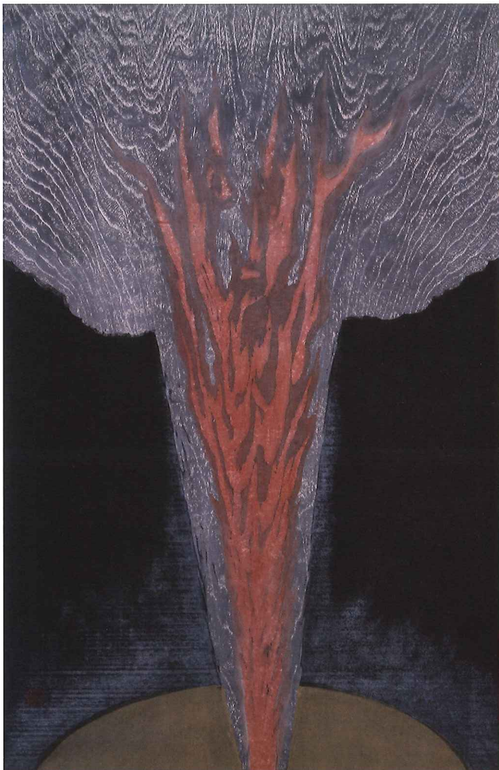
守 洞春《弥勒出現の日》1972年