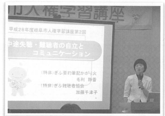
【第2回 毛利さんの講演の様子】

今年度の「人権学習講座」も、より多くの市民の方に参加していただこうと、ぎふメディアコスモスと市周辺地域施設において、3回シリーズ2会場で開催しました。各地域・各種団体、学校・企業関係者等延べ510名の参加があり、熱心に学習しました。