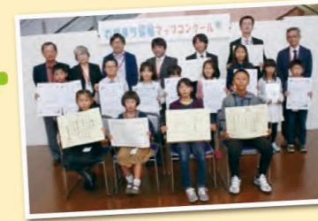
▲受賞されたみなさんおめでとうございます!