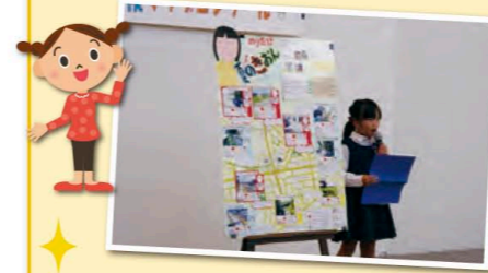
▲子どもたちが自分たちのまちへの想いを発表してくれました。