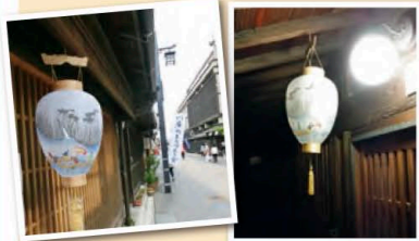
▲川原町提灯 ▲門灯に照らされる提灯

川原町では以前から岐阜市が準備した提灯を飾っていましたが、岐阜提灯型(提灯上部が下方より太い形)の提灯を飾りたいというまちづくり会からの発案で、行政や金華地区にある提灯屋さんの協力で準備をされました。毎年鶏飼開催期間中に飾られています。