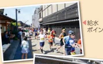
▲給水ポイント ▲ふるまい

一般財団法人 岐阜市にぎわいまち公社(中心市街地整備推進機構・景観整備機構) 平成28年11月発行 岐阜市柳ヶ瀬通1-12(岐阜中日ビル2階) TEL 058-266-1377 FAX 058-215-7155 ホームページ http://www.gifu-nigiwai.org