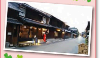
▲平成13年7月から活動している「川原町まちづくり会」を紹介します。