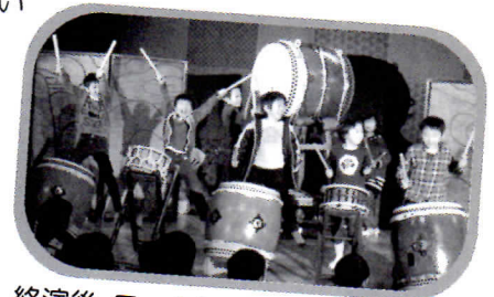
終演後、ワークショップがあります!