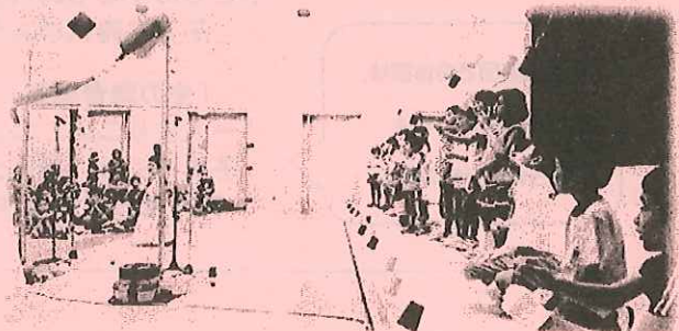
演奏終了後、体験コーナーもあります！

会場いっぱい張り巡らせた 約100本のストリングラフィから 童謡やクラシック 動物の鳴き声まで 飛び出してきます！