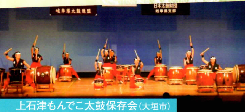
日本太鼓財団 岐阜県支部