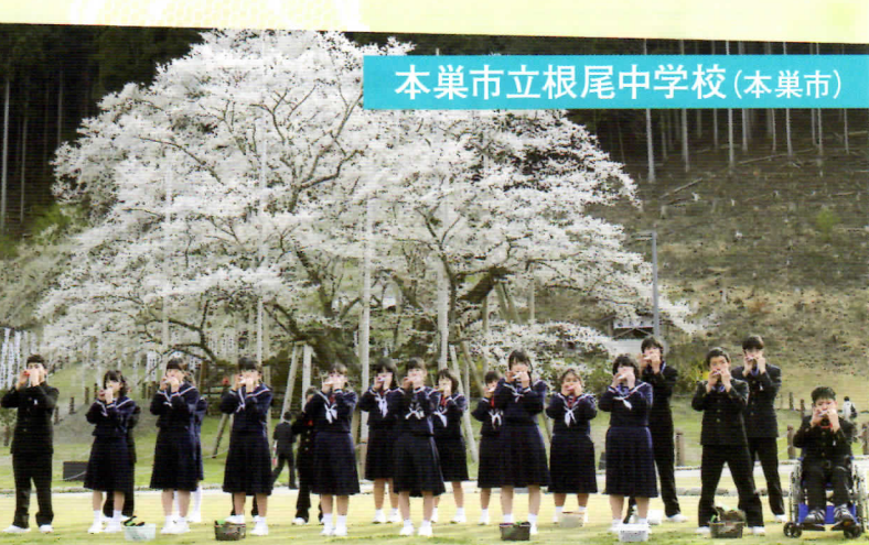
本巣市立根尾中学校(本巣市)