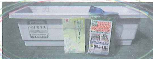
緑のカーテンセット

会場では、家庭で集めた 雑誌み(1kg程度)を持っ てくるとエコグッズと 交換します! ご協力お願いします!