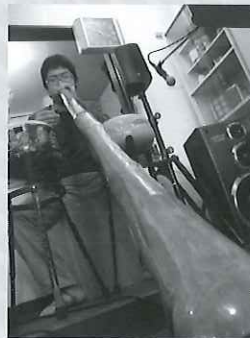
倍音人Road (ばいおんびとろーど)

一宮市長島町のタヒチアンダンススタジオfeti'iです。feti'iはタヒチ語で「家族」という意味です。タヒチアンダンスの楽しさを1人でも多くの方にお伝えしたいと思っています。feti'iは幅広い年代の方に楽しんで頂いてます。美しく年を重ねていきましょう!!