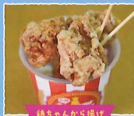
鶏ちゃんから揚げ