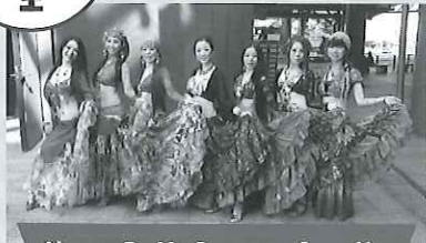
Neşe BellyDance Studio

岐阜、愛知をはじめ、各地で活躍しているベリーダンサーが集結。きらびやかな衣装をまとい、華やかに舞い踊ります。オリエンタル、ターキッシュロマ、フュージョン、アメリカントライバルスタイルなど、幅広いジャンルのベリーダンスをお楽しみください。