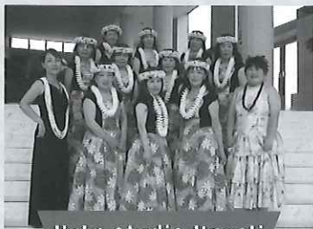
Hula studio Hauoli

岐阜、愛知をはじめ、各地で活躍しているベリーダンサーが集結。きらびやかな衣装をまとい、華やかに舞い踊ります。オリエンタル、ターキッシュロマ、フュージョン、アメリカントライバルスタイルなど、幅広いジャンルのベリーダンスをお楽しみください。