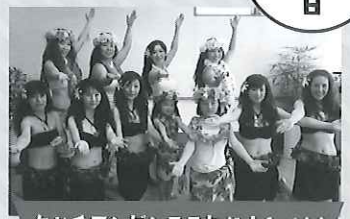
タヒチアンダンススタジオfeti'i

一宮市長島町のタヒチアンダンススタジオfeti'iです。feti'iはタヒチ語で「家族」という意味です。タヒチアンダンスの楽しさを1人でも多くの方にお伝えしたいと思っています。feti'iは幅広い年代の方に楽しんで頂いてます。美しく年を重ねていきましょう!!