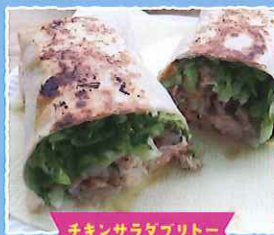
チキンサラタワリト