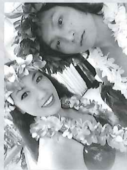
Te Nati Here

私たちはタヒチアンダンスがきっかけで出会い、今は夫婦で活動しています。日本語で「重なり合う愛」という意味のコンビ名Te Nati Hereは、現地のタヒチアンダンサーに名付けてもらいました。フラダンスの原点といわれているタヒチアンダンスはまだ日本ではあまり知られていませんが、私たちを通して魅力を感じていただけたら嬉しいです。