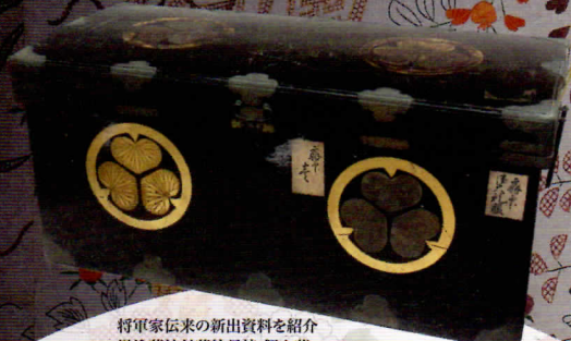
将軍家伝来の新出資料を紹介 黒塗葵紋付袴絵長持 個人蔵