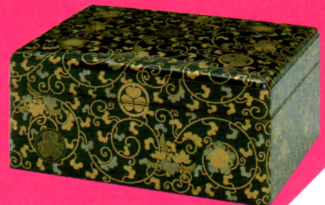
黒塗葵葉菊紋散花桐唐草蒔絵紙箱 和宮所用 徳川記念財団蔵

第1室 ・絵画の中の生き物たち 11月27日(日)まで 第2室 ・モダンアート協会会員 中風明世展 11月6日(日)まで ・～会派を越えた熱き魂の日本画家たちの挑戦～ 湧湧展 11月8日(火)から11月27日(日)まで