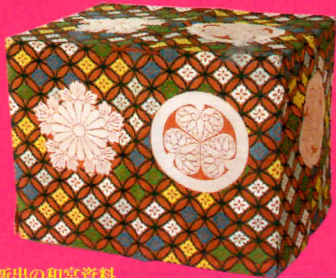
新出の和宮資料 葵葉菊紋付唐織油車 和宮所用 個人蔵