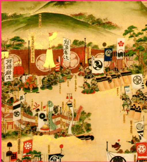
関ヶ原合戦図屏風(部分) 岐阜市歴史博物館蔵