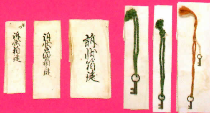
将軍が持った目安箱の鍵 訴状箱鍵 個人蔵(徳川宗家文書)

江戸時代、美濃国は大名や旗本の領地が錯綜しており、一国を治めるような領主は存在しませんでした。しかし、全国を治めた徳川将軍家との関係に着目すると、美濃国の江戸時代像を豊かにすることができます。初代将軍である家康の長女亀姫が嫁した奥平信昌が加納の地を治めるとともに、10万石を超える幕府直轄領が設置され、現在でも名産と知られる鮎鮎や蜂屋柿・真桑瓜が将軍家へ献上されました。幕末に至ると14代将軍家茂へ嫁いだ皇女和宮が、中山道を通行し美濃国にも多くの足跡が残っています。