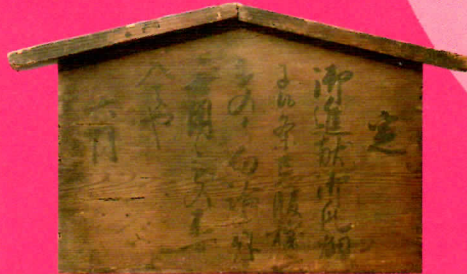
美濃の真桑瓜が将軍のお膝元へ 瓜制札 府中市郷土の森博物館蔵