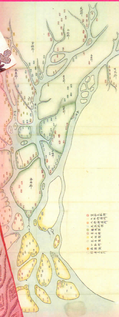
浪勢尾川通村々領土地顏色分給図(部分) 岐阜県歴史資料館蔵

白輪子地主立部菊牡丹藤模打掛 伝和宮所用 徳川記念財団蔵 ※展示期間 2016年10月7日～23日