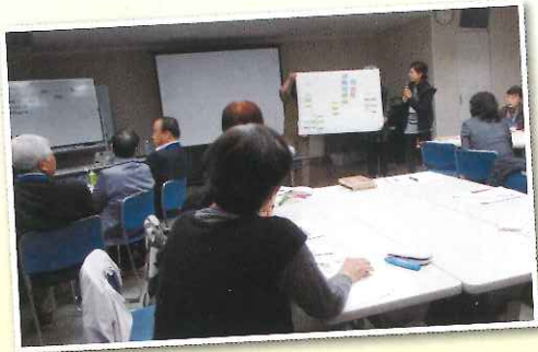
昨年のコース講座の様子