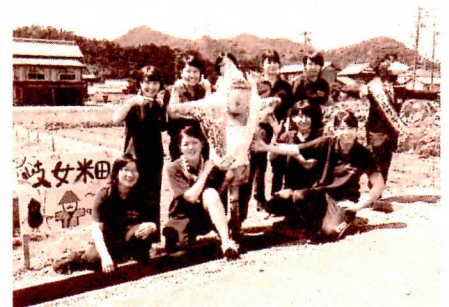
防犯標語たすきを作成した皆さん

「声かけで守ろう子どもと地域の輪」などと記載された6枚の防犯たすきをかかしに取り付け、通行人や見物の人達に対する防犯啓発活動を実施しました。