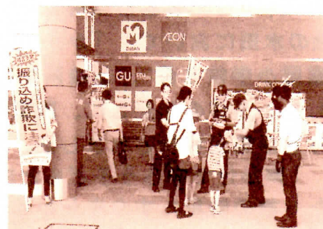
広報啓発活動の様様