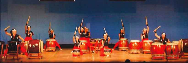
上石津もんでこ太鼓保存会(大垣市)