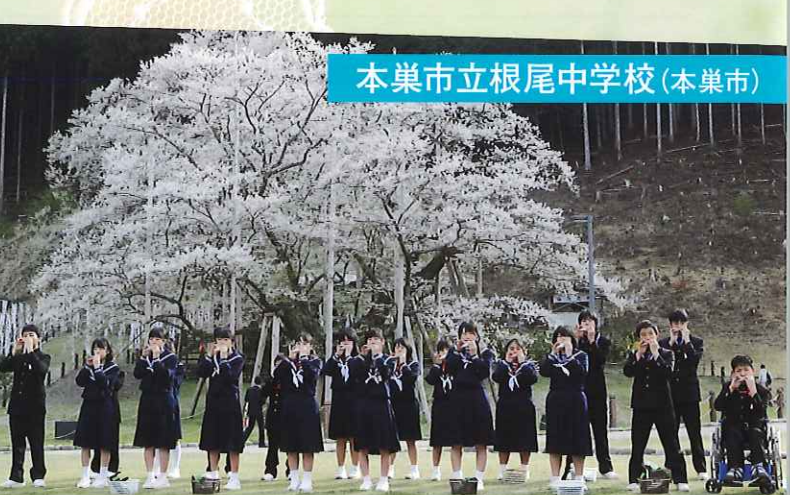
本巢市立根尾中学校(本巢市)