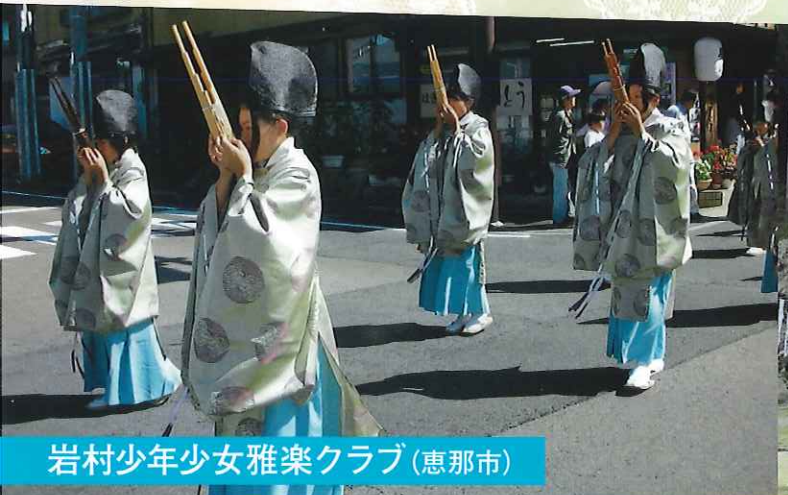
岩村少年少女雅楽クラブ(恵那市)