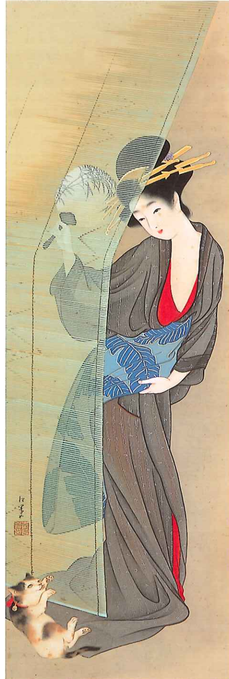
上村松園(夏の美人)大正2(1913)年頃