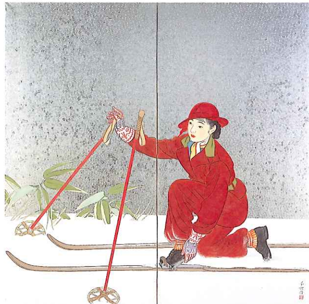
榎本千花俊(スキー)昭和初期