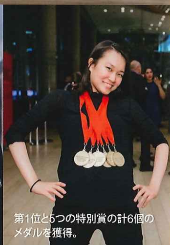
第1位と5つの特別賞の計6個のメダルを獲得。