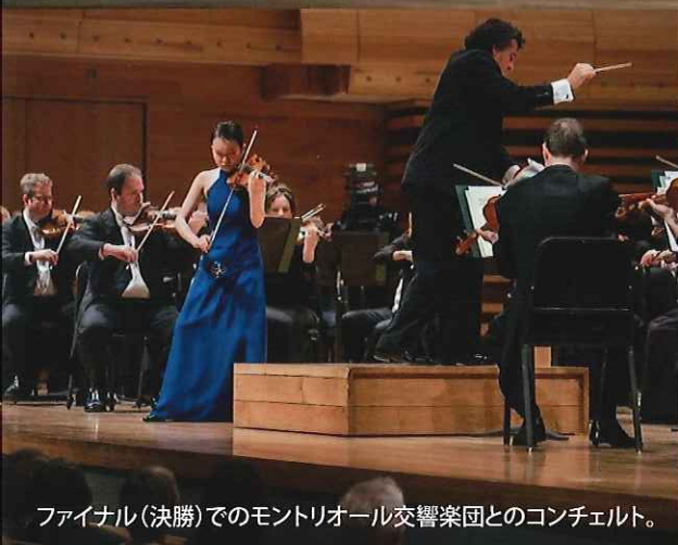
ファイナル(決勝)でのモンリオール交響楽団とのコンチェルト。

受賞記念特別価格: 1,000円 《全席指定》 [サラマンカメイト: 900円 / 学生 (30歳まで): 500円]