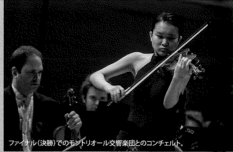
ファイナル(決勝)でのモントリオール交響楽団とのコンチェルト。

今年私が「挑戦」する2つのこと、1つはモントリオールのコンペティション、もう1つは11月に初CDレコーディングをチェコで行うこと。毎日が「挑戦」、このコンサートも「挑戦」だと思います。今の私の「挑戦」を皆様にお聴きいただければ嬉しいです。