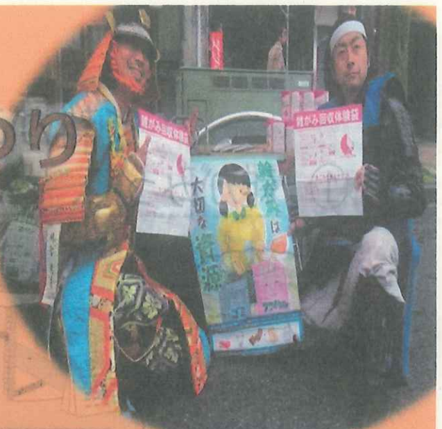
※第44回道三まつりの様子

お菓子の空箱や包装紙、コピー用紙などの 雑がみ をごみに出していないですか？ 雑がみ はリサイクルできる大切な資源です！ 家庭で集めた “雑がみ” を持って、第60回ぎふ信長まつりに参加しよう！