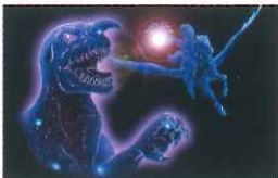
勇者ペルセウスと化けくじらの戦い

次に四辺形の西と東の辺をそれぞれ南の空までのぼしてみましょう。西側の辺の先には、秋の星座の中でただ一つの1等星、みなみのうお座のフォーマルハウトが、東側の辺の先にはくじら座のデネブカイトスが見つかります。