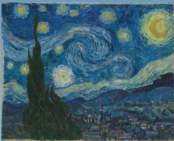
『星月夜』 ニューヨーク近代美術館蔵