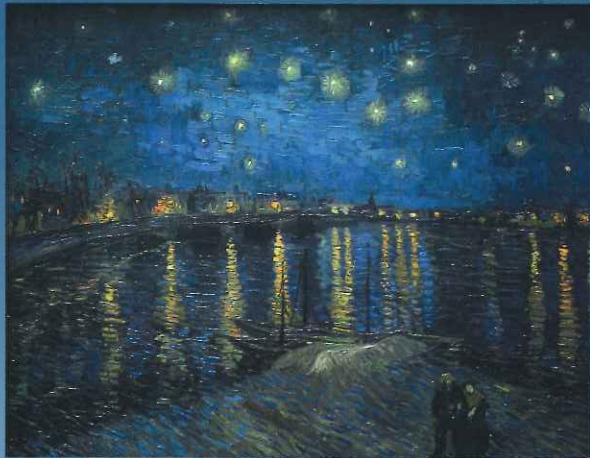
『ローヌ川の星月夜』 オルセー美術館蔵

星空を見ていると、わたしはいつも夢に誘われる。 汽車に乗って、いろんな町に行けるなら、 何かに乗って、どこかの星にも行けるはずだ。