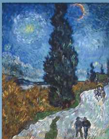
『星月夜と糸杉のある道』 クレラー=ミュージアム美術館蔵

フィンセント・ファン・ゴッホ Vincent Van Gogh (1853 ~ 1890)