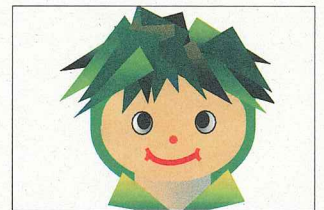
芥見東まちづくり協議会 (第3回~第4回)

グラフィックデザインや環境造形の仕事を続ける傍ら、様々なまちづくりのサポートや人材育成事業に携わる。現在、総務省地域力創造アドバイザー、新潟県地域づくりアドバイザー、NPO法人都岐沙羅パートナーズセンター理事、他