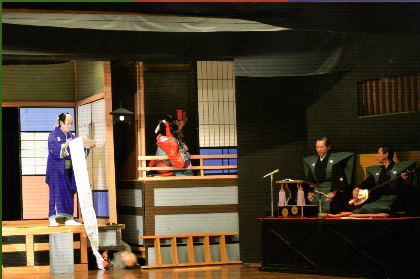
鳳凰座 歌舞伎公演「一力茶屋」