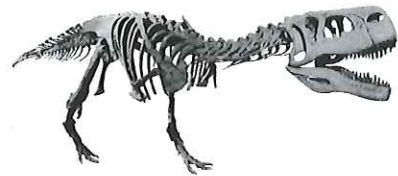
アウカサウルス (福井県立恐竜博物館蔵)