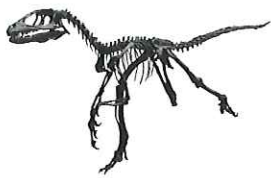
ディノニクス (岐阜県博物館蔵)