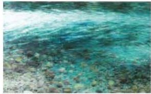
板取川の水明・関市洞戸