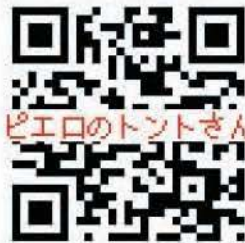
ピエロのトントさん