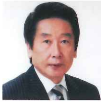
岐阜市長 細江茂光氏