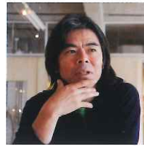
アーティスト 日比野克彦氏

定員：200名(先着順) 配布場所：ドキドキテラス前 当日入場整理券配布 配布時間：9:30