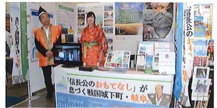
平成27年度のブース出展(会場:東京国立博物館)

各地の日本遺産にまつわる展示を行います。 (PR映像放映、パネル・名産品の展示等)