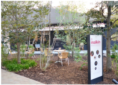
【景観奨励賞 風景・まちづくり部門】 BRASSERIE malkin 柳ヶ瀬通 (ブラスリー マルキン)