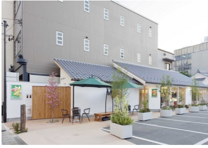
【景観奨励賞 風景・まちづくり部門】 GOTOYA dolce RACCONTO 美園町 (ゴトウヤ ドルチェ ラコント)