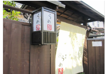
【景観奨励賞 屋外広告物部門】 うめ邑 長良白妙町