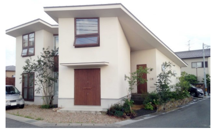
【景観奨励賞 建築物部門】 北一色の家 北一色