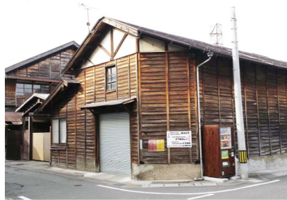
【景観賞 風景・まちづくり部門】 山川醸造 長良葵町