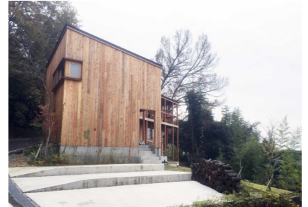
【景観賞 建築物部門】 高台の家 長良 長良竜東町