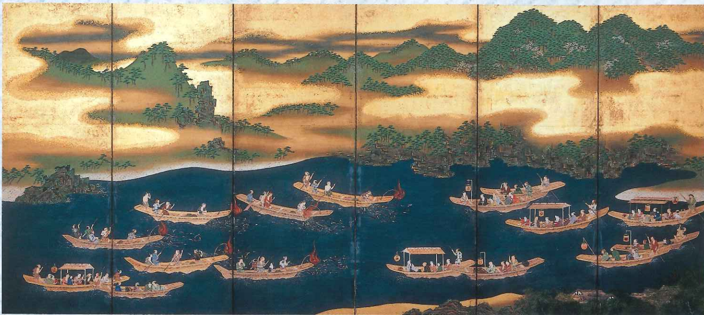
▲鵜飼遊楽図屏風 右隻(江戸時代中期・当館蔵)