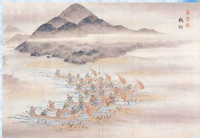
▲美濃飛騨両国魚漁之図「鵜飼」(明治時代・当館蔵)