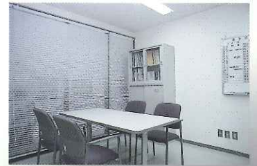
創業相談コーナー