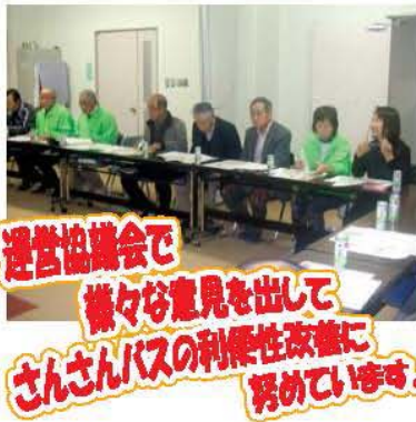
運営協議会で 様々な意見を出して さんさんバスの利便性改善に努めています。

平成26年9月から始まった鷺山、常磐、長良西の3校区内を運行するコミュニティバス「さんさんバス」の試行運行も、1年半が過ぎました。その間、さんさんバスの利用状況を踏まえて「運行ルートの変更」「バス停の設置箇所の変更」等を行い、少しずつ課題を克服し、さんさんバスの利用促進に努めてきました。その間も、さんさんバスの利用状況について、鷺山・常磐・長良西校区のメンバーで構成する「運営協議会」にてモニタリングを進めていった結果、平成28年4月より「本格運行」(平成31年3月までの3年間)に移行し