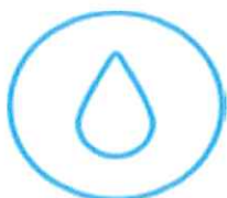
アーユルヴェーダ

「伝統的なアーサナ（ポーズの実践）とプラーナーヤマ（呼吸法）を中心に、説明を加えながら体感していただけます。初心者の方から経験者の方まで、どなたでもご参加いただけます。」