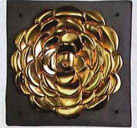
金箔飾り瓦・菊花文復元、牡丹文復元 (岐阜市教育委員会 蔵)