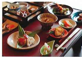
「信長おもてなし御膳」イメージ

平成27年に「『信長公のおもてなし』が息づく戦国城下町・岐阜」が日本遺産第1号に認定されたことを記念して開催する企画展の観覧と、鶺鴒の家 すぎ山にて料理長による復元料理の解説と「信長おもてなし御膳」をお楽しみいただけます。