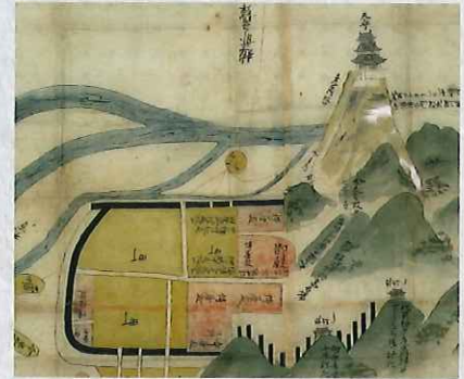
岐阜城攻防図 (部分) (岐阜市歴史博物館 蔵)