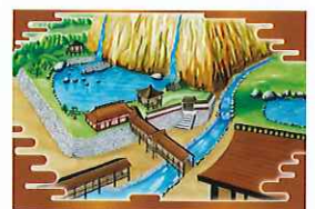
山麓居館の庭園復元イメージ

「『信長公のおもてなし』が息づく戦国城下町・岐阜」が日本遺産第1号として認定されるまでの取り組みと現代にもつながる信長公のおもてなしの心について、特別展示の案内を交え解説していただきます。