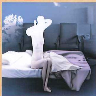
三尾 勲三 《Encore》1977年