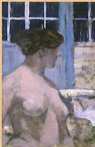
藤島武二 《浴室の女》1906-07年頃