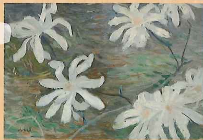
長原孝太郎 《辛夷》1914年