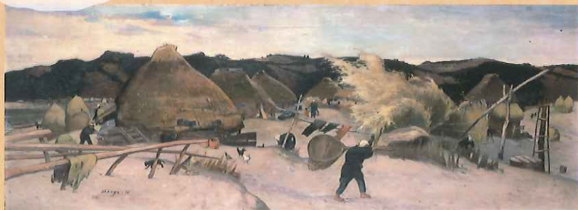
渡部 春也 《房州風景》1910-20年頃