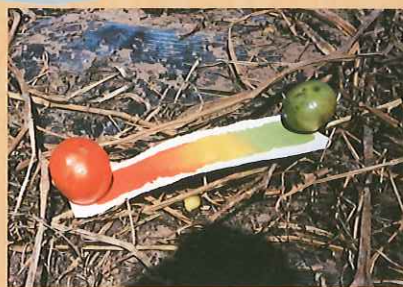
小本章 《Seeing 74-1》1974年