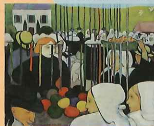
エミール・ベルナル 《ポンタヴェンの市場》1888年