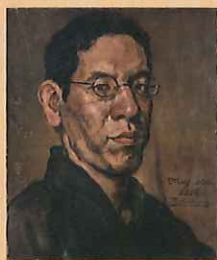
岸田 劉生 《自画像》1914年