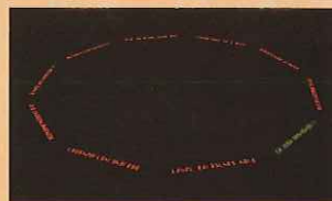
宮島達男 《Opposite Circles》(部分)1992年