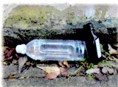
屋外に放置された空きビン、缶、ペットボトル