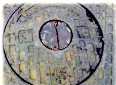
マンホールの蓋のくぼみ