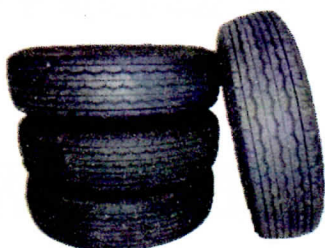
古タイヤに溜まった水たまり