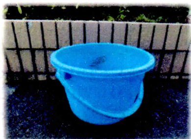
雨ざらしのバケツ、じょうろ