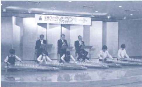
岐阜県邦楽三曲会