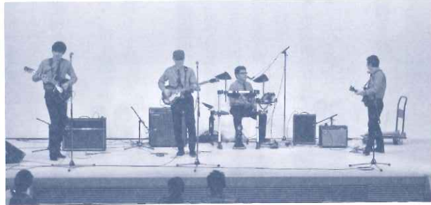
ぎふメディアコスモスみんなのホール

○11月8日(日) せせらぎの並木ミュージックコンサート実行委員会 さんぽ de 野外ライブ