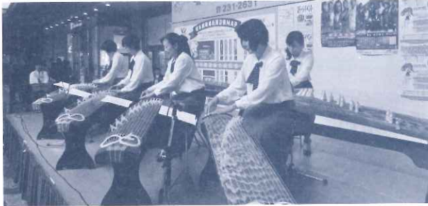
高島屋前わくわくステージ