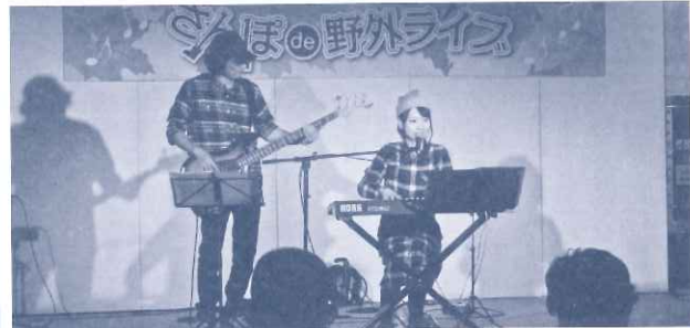
市役所本庁舎1F市民ホール