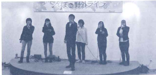
あい愛ステーション

○11月8日(日) せせらぎの並木ミュージックコンサート実行委員会 さんぽ de 野外ライブ