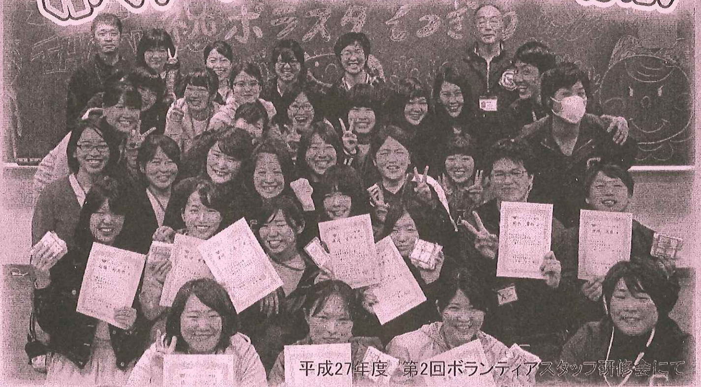
平成27年度 第2回ボランティアスタッフ研修会にて