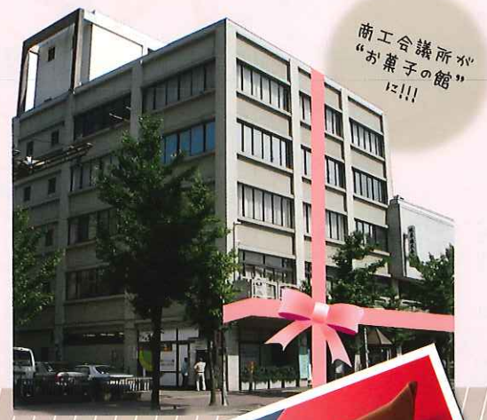
商工会議所が “お菓子の館” に!!!

アクセス方法 公共交通機関をご利用ください 名鉄名古屋本線「名鉄岐阜」駅より徒歩13分 JR東海道本線「岐阜」駅より徒歩18分 ※徒歩1分80mで計算しています。