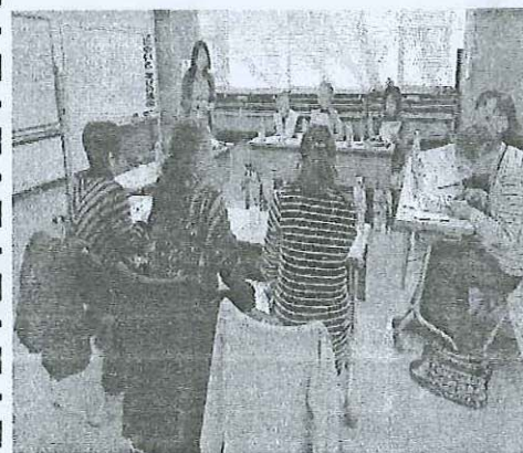
▲最終回 意見交流会の様子

2月11日(木)に「出会いと学びの講座」の修了生の集いを実施しました。「出会いと学びの講座」の最終回にて、ボランティア体験の感想や講座を受講して感じたことなどの意見交流をした際、「またこのメンバーで集まりたい」という修了生の想いが共有でき、実施する運びとなりました。「今後も定期的に集まり、自分たちに何ができるか考え、グループとしてボランティア活動をしていきたい。」という心強いお言葉を聞くことができました。全5回という講座でこれだけ深い受講生同士のつながりができたことに感動しました。ボランティアセンターとしましても、グループとしての活動が軌道に乗るよう、精いっぱいサポートしていきます!!