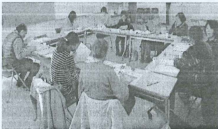
◀修了生の集いの様子