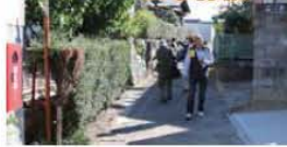
お散歩しながらまち歩き

たれていません。参加者みなで課題を見つけ、解決に向けた方策を考えるため「 まち探検 」も行っています。まだ、どのようなまち抱える課題を解決し、地域住民が幸せになる「 まちづくりのビジョン 」が練り上げられるといいですね。このワークショップの詳細はQRコードから確認できます。(PDFファイル)