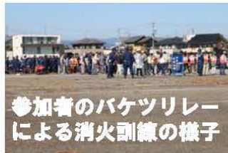
参加者のバケツリレーによる消火訓練の様子

来年度は、この岐阜市総合防災訓練の当番地区が、鷺山になります。地域全体で防災意識を向上させて「減災」に向けての活動を積み重ねていきたいです。