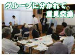
グループに分かれて意見交換

鷺山中洲まち育て広場 まちの課題解決に向けて 鷺山本通りの北側のエリアである「中洲」と呼ばれるエリアでは、昔ながらの農地が広がる中、住宅が点在しています。旧鷺山保育所は、現在では「鷺山子ども館」として活用されています。このエリアも時代の変化と共に、 空き家が目立つようになっています 。また、 エリア内の道路も狭く、生活面で不便な点や緊急車両の進入時に不安 もあります。この様な状況を改善するためには、どのようなまちづくりが必要なのか？現在、中洲での土地地区画整理の実施に向けた世話人の皆さんを中心に、ワークショップ形式の話し合いがも