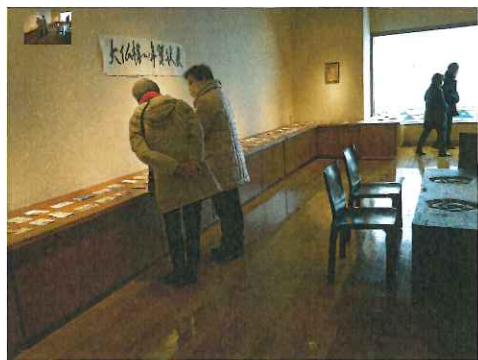
大仏様への年賀状展の様子