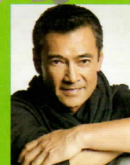
特別ゲスト 俳優&ジャズドラマー 渡辺 裕之

岐阜市民会館、岐阜市文化センター、長良川国際会議場 チケットぴあ(Pコード278-295)、マサ21サービスカウンター 生活協同組合コープぎふサービスカウンター(芥見店)