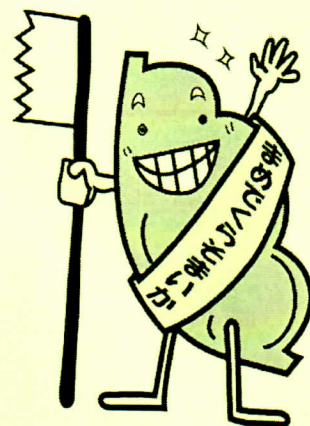
まめくらシルバー