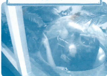
頭を出すと目の前にはヤシガニが! ヤシガニの目線になって迫力の姿を観察 できるよ!