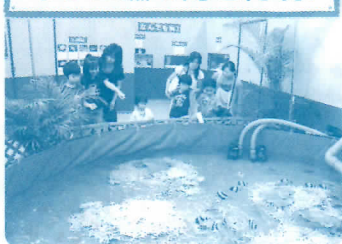
巨大プールでサンゴ礁の海を再現! 迫力のステージの中をカラフルな魚たち が舞う姿は感動すること間違いなし!