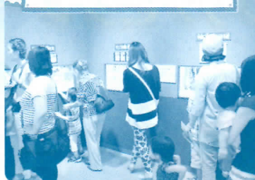
色鮮やかな魚をはじめとする海の生き物たちの生き生きとした姿をじっくり観察しよう。