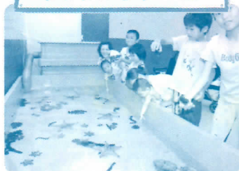
海の生き物に実際に触れることができる コーナーです。海がない岐阜では貴重な 体験ですね。