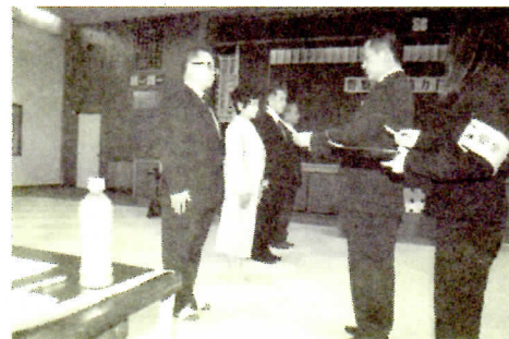
新規委嘱状交付の様様