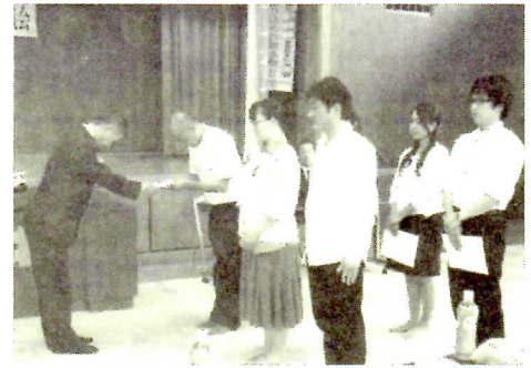
委嘱状交付の様様

少年警察ボランティアとは、少年の非行を防止し、健全育成を図るため、街頭補導活動など非行防止活動をしていただく警察本部長委嘱の少年補導員で、岐阜北地区では49名が委嘱されています。