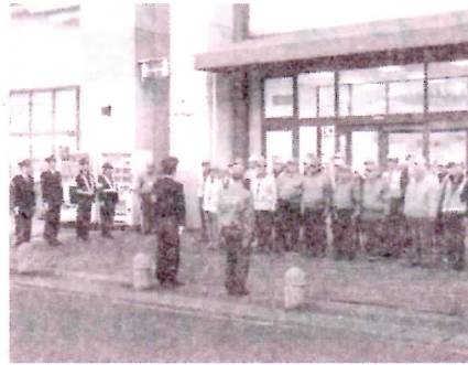
バロー長良店で活動中の皆さん