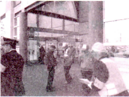
マーサ21で活動中の皆さん

各店舗の出入口で「年末年始地域安全運動」「振り込め詐欺の被害防止」のチラシ等を来店者に配付し、犯罪被害を未然に防止して、安全で平穏な新年を迎えるよう呼びかけました。