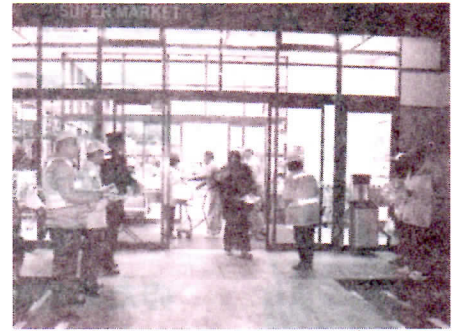
バロー粟野店で活動中の皆さん