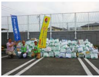
↑市民大運動会での雑がみ回収では740kg、袋で465個回収できました。

現在、岐阜市はゴミ減量活動の一環として、雑がみの資源分別回収に力を入れ取り組んでいます。鷺山校区でも、市民大運動会での出張雑がみ交換所の開設をはじめ、毎月第3火曜日の資源分別回収での雑がみ回収に力を入れています。その結果、平成26年10月の雑がみ回収量は、昨年度10月の7.6倍にあたる2590kgを回収できました。この調子で雑がみの資源分別回収が進み、年明けに発表される各校区対抗の雑がみ回収グランプリで鷺山が岐阜市一位に輝けばうれいすね。 また、岐阜市の資源分別回収のルールは、右のQRコードから確認できます。