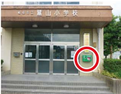
↑鷺山小学校正面玄関にAEDが設置されました。緑の箱が目印です。

鷺山小学校に設置されていたAEDの使用期限が経過したことに伴い、新しいAEDが設置されました。設置箇所は 鷺山小学校正面玄関 です。 今まで体育館の中に設置されていたのですが、夜間、週末等体育館閉館時は取りに行くのに時間がかかることが心配されていました。今回小学校正面玄関に設置され、鷺山小学校が休みの中でも速やかに活用できるようにになりました。万が一、AEDが必要な事態に直面したら、鷺山小学校正面玄関に設置されていることを思い出してください。