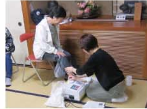
平成26年10月18日(土)に鷺山公民館にて健康講座が開催されました。健康講座には120名の皆さんが参加され、寝たきり生活になることを予防するために必要な丈夫さを確認するための骨密度の測定や、生活習慣病を予防するための