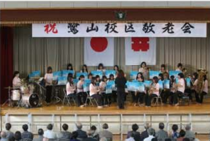
↑ 毎年恒例となっている大垣女子短期大学ウィンドアンサンブルの皆さんが、お祝いの演奏にかけつけてくださいました。