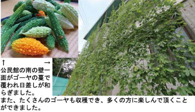
↑ 公民館の南の壁一面がゴーヤの蔓で覆われ日差しが和らぎました。また、たくさんのゴーヤも収穫でき、多くの方に楽しんで頂くことができました。

鷺山公民館では、日差しを和らげるために南側壁面に、ゴーヤの緑のカーテンを育てる取り組みに挑戦しました。その結果、真夏には2階まで蔓が伸び、厳しい日差しを和らげることができました。また、多くのゴーヤも実り、公民館利用者に楽しんで頂けました。来年も、素敵な緑のカーテンができればいいですね。